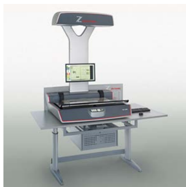
Table pour scanner OS 12000 A1