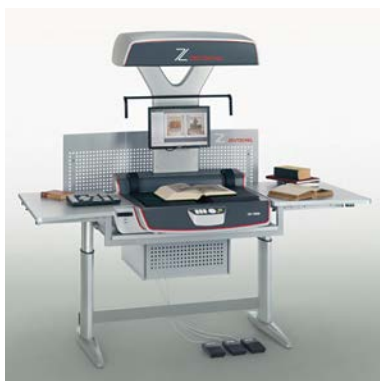
Table pour scanner OS 12000 Advanced Plus