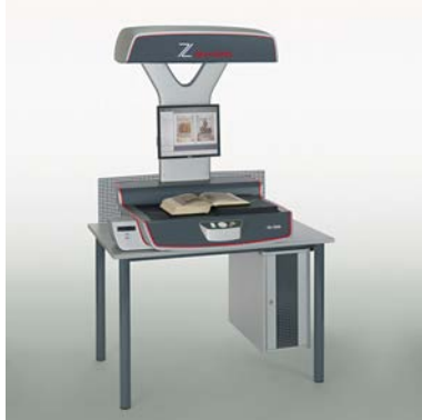
Table pour scanner OS 12000 Basic