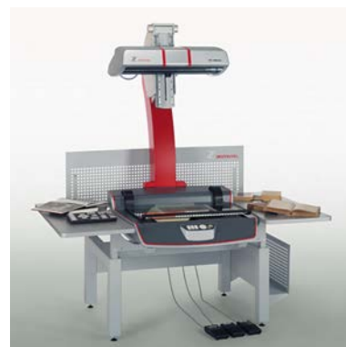
Table pour scanner OS 14000 TT