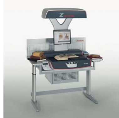
Table pour scanner OS 12000 Advanced