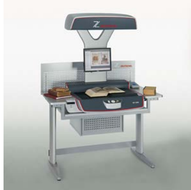
Table pour scanner OS 12000 Comfort